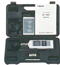
本体はハードケース入り(収納、保管用)