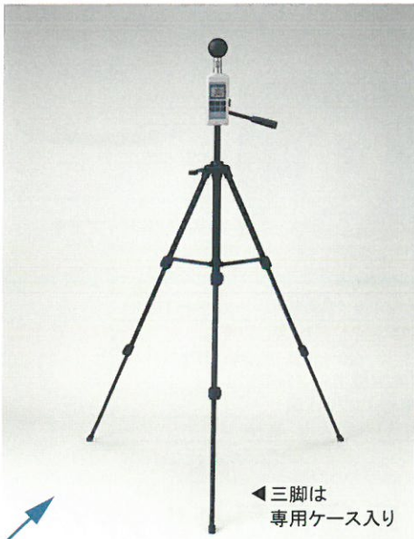
三脚は専用ケース入り

黒球温度の正確な測定には一定の高さが必要です。連続測定するためにも三脚のご使用をお勧めします。